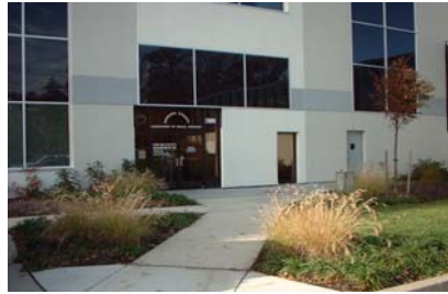
Division des Services Sociaux

*Pas de demandes acceptées le mercredi — d'autres services disponibles)