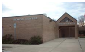
BUREAU DE SAVAGE

Les Services: Immunisations , Jeune et famille adulte, soins prénatals gratuits, planning familial , test et conseil du HIV et des infections sexuellement transmissibles, programme de nourrisson et enfant , Healthy Start Program, soins de santé aux réfugiés, immunisation contre venin, séance d'information sur la tuberculose, le sida.