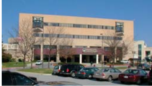
Howard County General Hospital

Appelez le 911 sur votre téléphone. Donnez votre nom, adresse, et numéro de téléphone. Donnez l'adresse où se trouve le cas d'urgence. Faites connaître ce numéro à vos enfants au cas où ils ont besoin d'aide quand vous n'êtes pas à la maison. Si vous ne parlez pas anglais, dites votre langue à l'opérateur pour avoir un interprète.