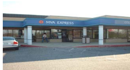
MVA Express, Columbia, MD

Services limités à : Renouvellement du permis de conduire, changement du nom ou adresse sur le permis Cartes d'identité avec photo, copies de votre dossier de conduire et restitution des plaques d'immatriculation.