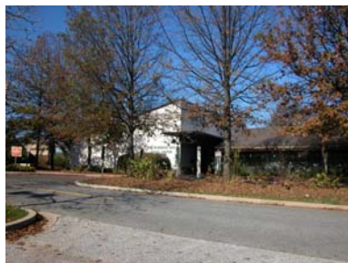
Florence Bain Center

(Centre pour les Aînés Florence Bain) 5470 Ruth Keeton Way Columbia, MD 21044 Téléphone : 410-313-7213 Heures d'ouverture : lundi à vendredi 8 h à 16 h 30