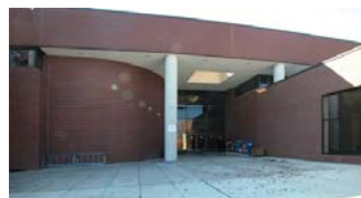
Legal Aid Bureau

Heures de bureau : Lundi à vendredi 8 h 30 à 16 h