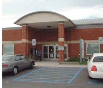
MVA Office, Beltsville ,MD

Adresse 11760 Baltimore Avenue MD Route 1 Beltsville, MD 20705 Téléphone: 410-768-7000 Heures : Lundi à Vendredi 10h 19h30 Samedi 8h30-16h pour les services