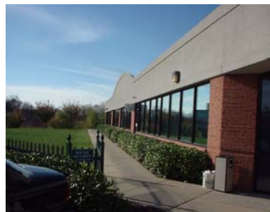
Lake Office Social Security Administration

Lundi à vendredi 9 h à 16 h (heures de bureau)